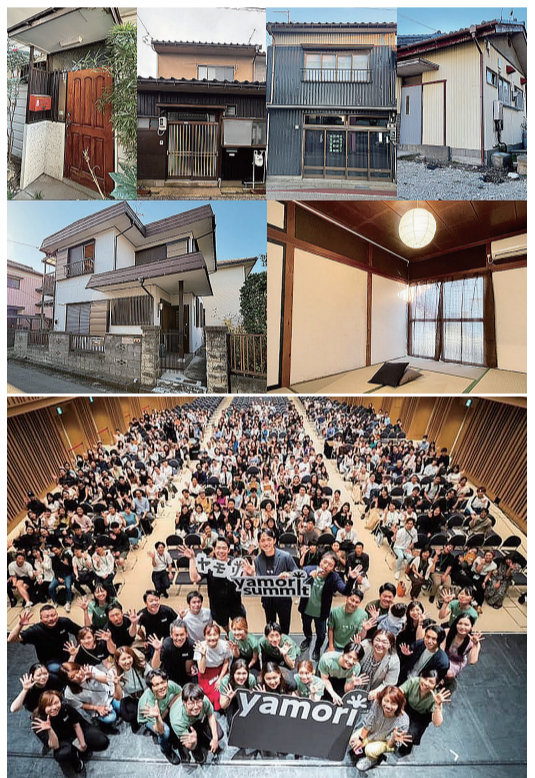
▲購入してリフォームした住宅の一例。定期開催するイベントにはオンラインを含め約1000人の投資家が集まる

今回調達した資金により進めていく事業は、大きく分けて二つ。一つ目は、不動産事業にヤモリが融資する「ヤモリローン」の提供だ。法定耐用年数を超えた物件を取得する際、金融機関から融資を受けることが難しく、これが中古不動産の流通が進まない要因の一つとなっていた。ヤモリが、物件の取得や修繕に対して無担保、金利5%返済期間15年で300万円まで融資することで、中古物件への投資をしやすくする。物件購入とい