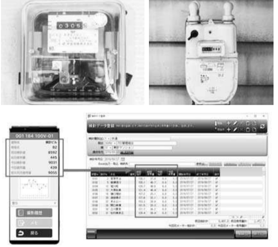
▲計測するメーターの種類を選択して撮影するだけ

「管理会社のヤモリ」は、管理会社の業務効率化に貢献する。一方、管理会社向けの「管理会社のヤモリ」は、不動産管理会社向けに開発されたクラウド型の賃貸管理サービス。不動産管理会社は、入居者管理、入金管理、月次明細作成などのノコア業務を全て外注