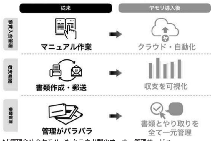
▲「管理会社のヤモリ」は、クラウド型のオーナー管理サービス

不動産事業者向けのサポートサービスが普及したことで、業務の効率化や作業負担の軽減に貢献した話題をいくつか聞く。一方、多様なニーズが最適なサービスが重要である。