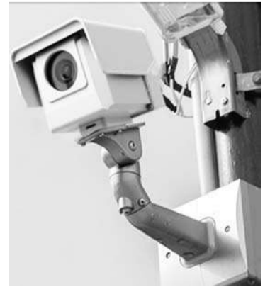
▲既設のカメラを利用することも可能

「管理会社のヤモリ」は、管理会社の業務効率化に貢献する。一方、管理会社向けの「管理会社のヤモリ」は、不動産管理会社向けに開発されたクラウド型の賃貸管理サービス。不動産管理会社は、入居者管理、入金管理、月次明細作成などのノコア業務を全て外注