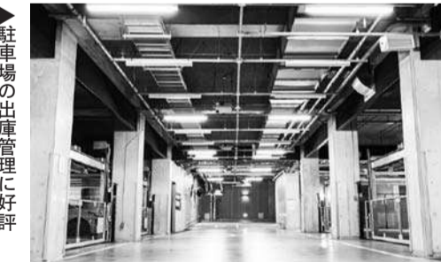
▶駐車場の出庫管理に好評

「管理会社のヤモリ」は、管理会社の業務効率化に貢献する。一方、管理会社向けの「管理会社のヤモリ」は、不動産管理会社向けに開発されたクラウド型の賃貸管理サービス。不動産管理会社は、入居者管理、入金管理、月次明細作成などのノコア業務を全て外注